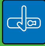
Poignées de portes