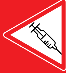
Echange de seringue