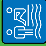
Piscine et Sauna