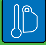
Manger et boire ensemble