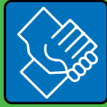
Serrer la main