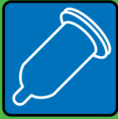
Sex avec préservatif