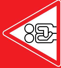
Sex sans préservatif

RISQUES • DANGER • RISQUES • DANGER • RISQUES • DANGER • RISQUES • DANGER • RISQUES... ...par • sang • spermes • liquide-vaginal • lait maternel