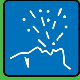
Tousser – éternuer